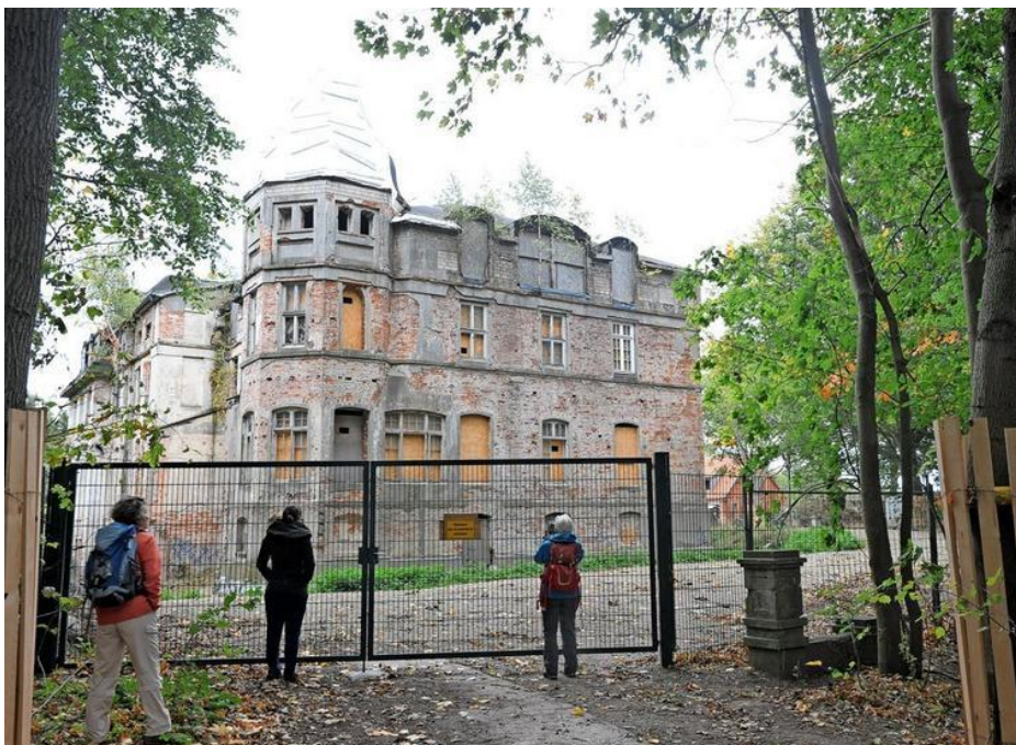
Das „Schloss“ genannte Herrenhaus in Pötenitz steht seit zwei Jahrzehnten leer. Es soll das Haupthaus für ein Ferienressort werden.

Später kaufte eine deutsche Tochterfirma der spanischen Avante-Gruppe die Immobilie. Sie setzte ihre Pläne für ein Hotel, Ferienwohnungen und Häuser nicht um. Das Gutshaus verfiel weiter. Schließlich verkaufte sie an die jetzigen Eigentümer.